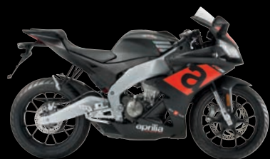
MAYPO - BLACK SPEED