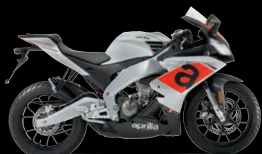
ΑΣΗΜΙ - SILVER SPEED