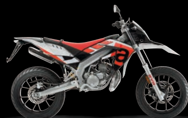
SX RED SPOT