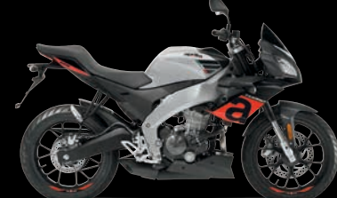
ΑΣΗΜΙ - SILVER SPEED