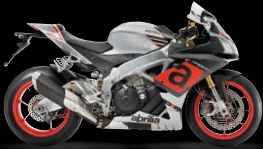
ΓΚΡΙ - BUCINE GREY