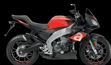
ΚΟΚΚΙΝΟ - RED ENERGY