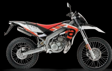
RX RED SPOT