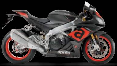
MAYPO - ASCARI BLACK