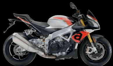
ΓΚΡΙ - PORTIMAO GREY