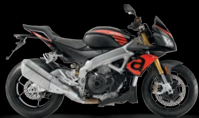
MAYPO - ASSEN BLACK